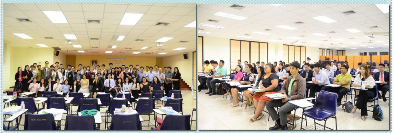
[27-07-2559] การประกวด Freshy KPRU 2016