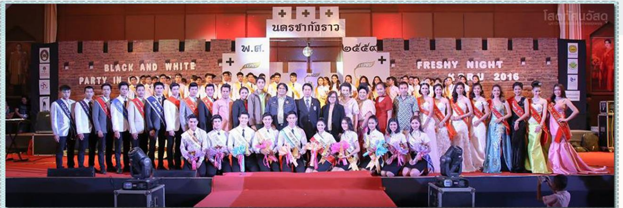
[14-07-2559] พิธีไหว้ครู 2559