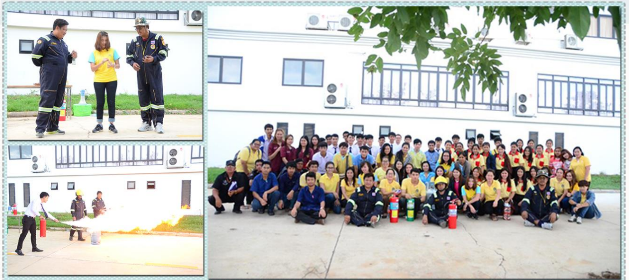
[15-06-2559] ปฐมนิเทศนักศึกษาใหม่ 2559