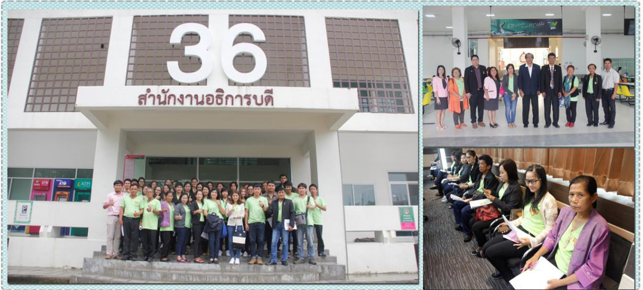
[24-06-2559] โครงการสาธิตใช้พลังงาน การให้ความรู้เรื่องการป้องกันอัคคีภัยฯ