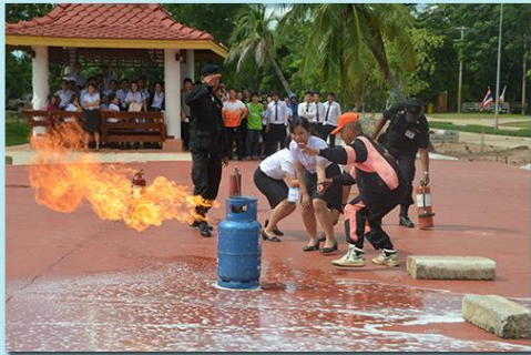
โดยมีกำหนดการ ดังนี้

เข้าร่วมโครงการลดใช้พลังงาน การป้องกันอัคคีภัย และบรรเทาสาธารณภัย ในวันจันทร์ที่ 10 สิงหาคม 2558 เวลา 08.30-16.00 น. ณ ห้องประชุมชั้น 3 (1431) อาคารเรียนรวมและอำนวยการ (อาคาร 14)