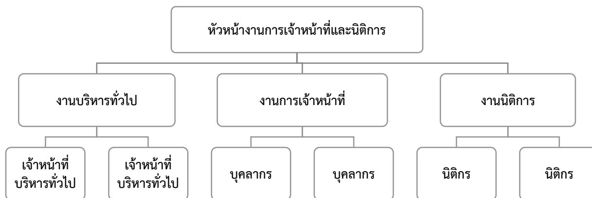
ตารางที่ ๒.๑ แสดงแผนผังแสดงโครงสร้างภายในองค์กร

สำหรับโครงสร้างของงานการเจ้าหน้าที่และนิติการ ประกอบไปด้วย งานบริหารทั่วไป งานการเจ้าหน้าที่ และงานนิติการ ซึ่งปรากฏตามแผนผังโครงสร้างหน่วยงานย่อยของงานการเจ้าหน้าที่และนิติการ สังกัดสำนักงานอธิการบดี ดังนี้